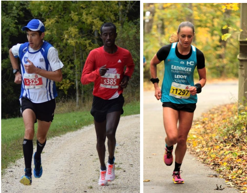
Foto Alb Marathon 2016, Sieger 50km und Siegerin 25km

Beim 27. Alb Marathon 2017 werden die deutschen Meisterschaften der DUV im Cross- und Landschaftslauf im Vordergrund stehen. Auch wenn es nun bereits die vierte deutsche Meisterschaft ist, die sich an den 3 Kaiserbergen entscheidet, so sind auch dieses Jahr spezielle Vorbereitungen erforderlich. Von Routine kann jedenfalls keine Rede sein.