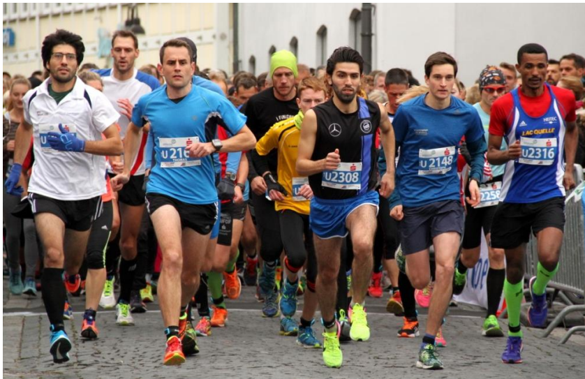
Foto Start 10 km Umicore-Lauf 2016