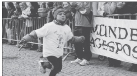
Mit Feuereifer bei der Sache waren auch die rund 500 Kinder und Jugendlichen bei ihren Marktplatzrunden.

Satz zurück macht er dann den Weg frei für die Kinder, die um ihn herum wuseln. Nach 500 Metern sind die Mädchen und Jungen im Ziel. „Auf, zieh' voll durch! Spitze, das schafftst Du!“, jubeln Eltern und Erzieherinnen den Kleinen zu.