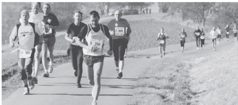
Der Sparkassen-Alb-Marathon 2008 zu den schönsten, aber auch härtesten Landschaftsläufen Europas. Fortwährend Herbstwetter und nicht kalte Temperaturen besuchten den Läuferinnen und Läufern auf dem Weg über die drei Katerberge auf dem Katerberg. Mit 1850 Sportlern wurde ein neuer Teilnehmerrekord verzeichnet.