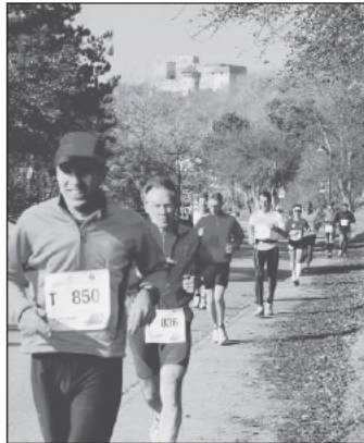
Nach bähnlein die Läufer entspannt. Doch gleich geht es den Kreuzweg hoch zur Wallfahrtskirche auf dem Hohenrochberg. Im Hintergrund die Ruine.