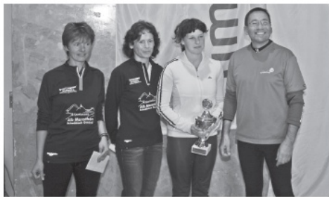
Siegerinnen und Sieger 10 km Umicore-Lauf