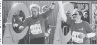
Gemeinsam über die Ziellinie. Der Triumpfwagen fährt.