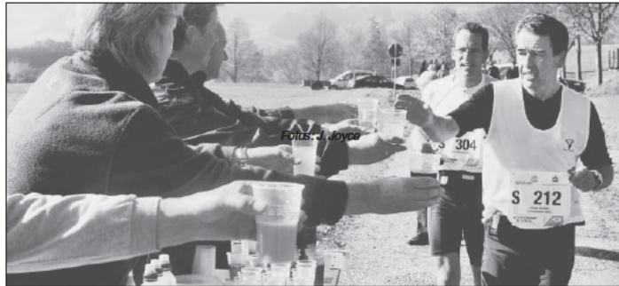
Cola, Tee, Wasser - die Läufer wurden an den Verpflegungsstellen bestens versorgt.