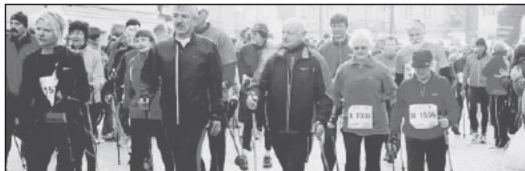
Gut zu Fuß waren auch die Nordic Walker, die zwar nur den Hohenstaufen zu bezwingen hatten, aber immerhin 30 Kilometer absolvieren mussten.