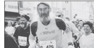
Markante Gesichter zeigten sich im internationalen Teilnehmerfeld dem Fotografen.