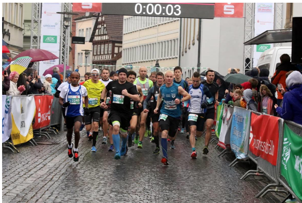
Start 10 km Umicore-Lauf 2018

Die Strecke führt vom Waldweg an der Nordseite des Stufen nicht mehr durch den Brauhof sondern auf einem vor wenigen Jahren neu angelegten und geschotterten Waldweg bergab um den Heckenhof herum und über den äußeren Bläsihof zur Hummelshalde. So erspart man sich den steilen Abstieg im Bronnforst.